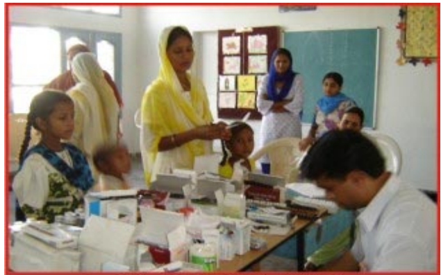
ਰਤਵਾੜਾ ਸਾਹਿਬ ਸਮਾਗਮ ਸਮੇਂ ਡਾ. ਸੰਗਤਾਂ ਦੀ ਸੇਵਾ ਵਿਚ।