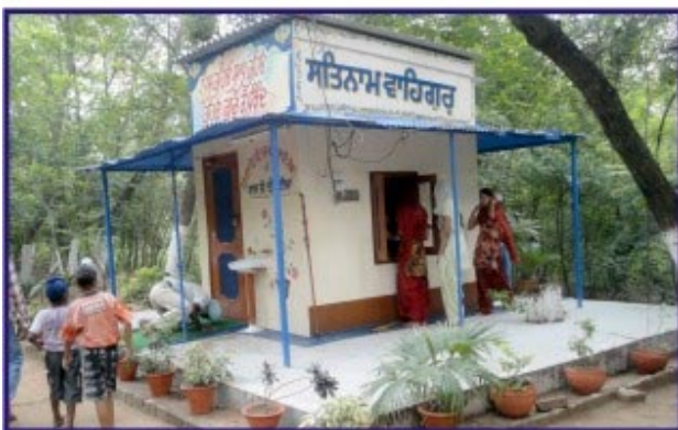
ਤਪੇ ਅਸਥਾਨ ਸੰਤ ਮਹਾਰਾਜ ਰਤਵਾੜਾ ਸਾਹਿਬ