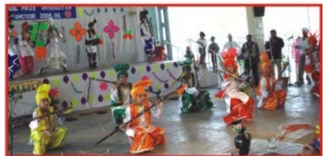
ਬੱਚੇ ਰੰਗਾ ਰੰਗ ਪ੍ਰੋਗਰਾਮ ਵਿਚ ਭਾਗ ਲੈ ਰਹੇ ਹਨ।