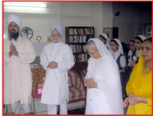
ਸ. ਮਨਮੋਹਨ ਸਿੰਘ ਜੀ ਪ੍ਰਧਾਨ ਮੰਤਰੀ, ਅਰਦਾਸ ਵਿਚ।