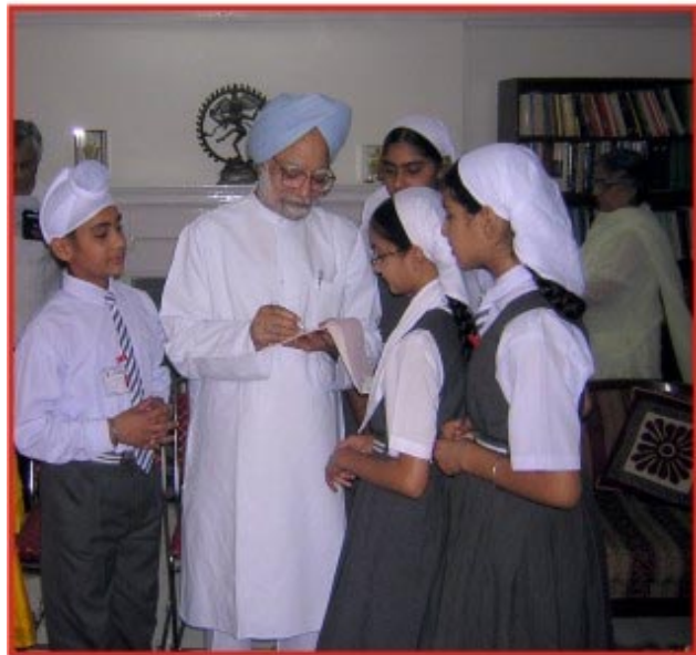
ਸ. ਮਨਮੋਹਨ ਸਿੰਘ ਪ੍ਰਧਾਨ ਮੰਤਰੀ, ਵਿਦਿਆ ਮੰਦਰ ਦੇ ਬੱਚਿਆਂ ਨੂੰ ਆਪਣੇ ਆਟੋ ਗੁਫ ਦਿੰਦੇ ਹੋਏ।