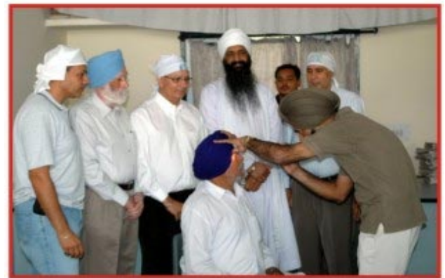
ਰਤਵਾੜਾ ਸਾਹਿਬ ਸਮਾਗਮ ਸਮੇਂ ਡਾ. ਸੰਗਤਾਂ ਦੀ ਸੇਵਾ ਵਿਚ।