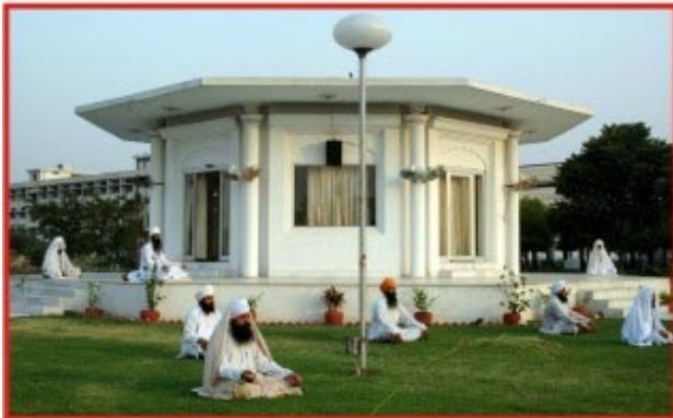
ਰਤਵਾੜਾ ਸਾਹਿਬ ਵਿਖੇ ਨਿਤਨੇਮ ਅਨੁਸਾਰ ਨਾਮ ਸਿਮਰਨ।