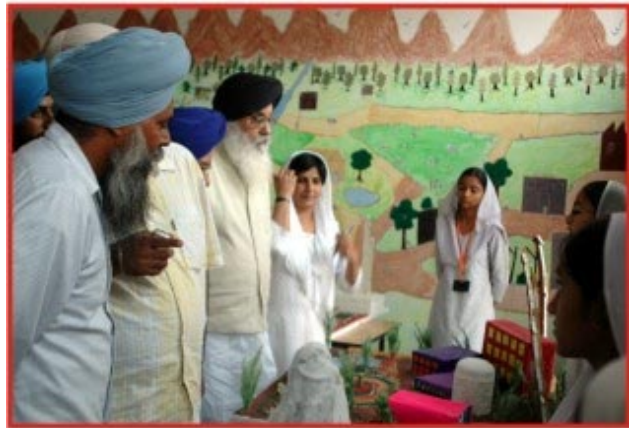
ਸ. ਪ੍ਰਕਾਸ਼ ਸਿੰਘ ਮੁੱਖ ਮੰਤਰੀ ਪੰਜਾਬ ਵਿਦਿਆ ਮੰਦਰ ਵਿਚ ਪ੍ਰਦਰਸ਼ਨੀ ਵੇਖਦੇ ਹੋਏ।