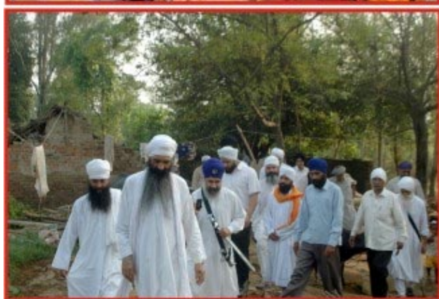
ਯੂ.ਪੀ. ਅਫਜਲਗੜ੍ਹ ਪ੍ਰੇਮਪੁਰੀ ਵਿਖੇ ਰਸਦ ਸਮੱਗਰੀ ਵੰਡਣ ਦੇ ਵੱਖ ਵੱਖ ਦ੍ਰਿਸ਼।