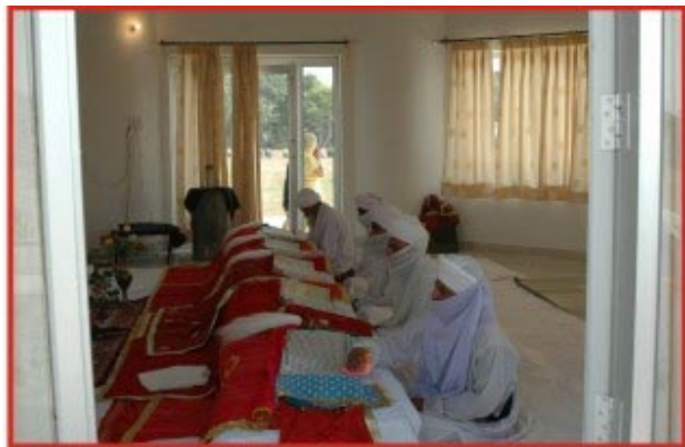
ਅੰਗੀਠਾ ਸਾਹਿਬ ਵਿਖੇ ਅਖੰਡਪਾਠਾਂ ਦੀ ਲੜੀ

ਹਰ ਸਾਲਾਨਾ ਸਮਾਗਮ ਨੂੰ ਵਿਦੇਸ਼ਾਂ ਵਿਚ NRI ਸੰਗਤ ਸੈਂਕੜਿਆਂ ਦੀ ਤਦਾਦ ਵਿਚ ਹਾਜ਼ਰੀ ਭਰਦੀ ਹੈ। ਇਨ੍ਹਾਂ ਦੇ ਰਹਿਣ ਲਈ ਉਚੇਚੇ ਪ੍ਰਬੰਧ ਹੈ ਜਿਸ ਵਿਚ ਮੌਟਨ ਟਾਈਪ ਕਮਰੇ ਅਟੈਚਡ ਬਾਥਰੂਮ ਦਾ ਪ੍ਰਬੰਧ ਵੱਖਰੀ ਚਿੰਨ ਮੰਜਲੀ ਬਿਲਡਿੰਗ ਵਿਚ ਕੀਤਾ ਜਾਂਦਾ ਹੈ ਉਨ੍ਹਾਂ ਦੇ ਸੁਭਾਅ ਅਨੁਸਾਰ ਵਿਸ਼ੇਸ਼ ਖਾਣ ਪੀਣ ਦਾ ਪ੍ਰਬੰਧ ਕੀਤਾ ਜਾਂਦਾ ਹੈ।