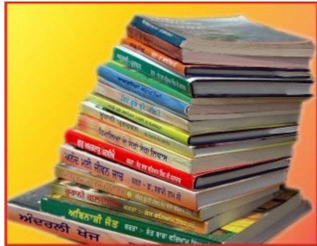
ਮਹਾਂਪੁਰਸ਼ਾਂ ਵਲੋਂ ਲਿਖਤ ਪੁਸਤਕਾਂ

ਵੀਡੀਓ ਕੈਸਟਾਂ - ਹੁਣ ਤਕ 3000 ਆਡੀਓ ਕੈਸਟਾਂ ਤਿਆਰ ਹੋ ਚੁੱਕੀਆਂ ਹਨ ਅਤੇ 1500 ਵੀਡੀਓ ਕੈਸਟਾਂ ਬਣ ਕੇ