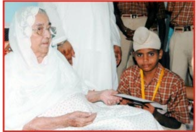
ਬੀਜੀ ਵਿਦਿਆ ਮੰਦਰ ਦੇ ਬੱਚਿਆਂ ਨੂੰ ਅਸ਼ੀਰਵਾਦ ਦਿੰਦੇ ਹੋਏ।